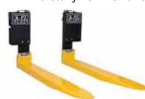
KPZ 76 M Váha na vysokozdvížné vozíky