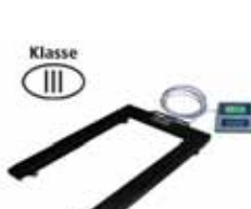
KPZ 1 M Ex Paletová váha