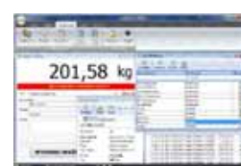
KPZ PC Software

Potřebujete jinou váhu, zvláštní produkty jsou naše specialita !