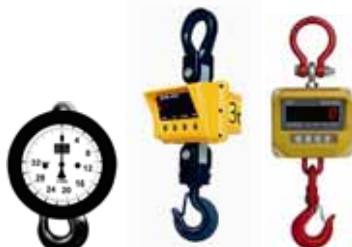
Jeřabové váhy M