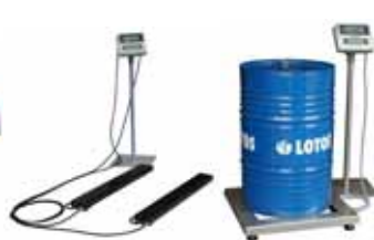
KPZ 1 B M KPZ 2 B M