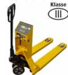
KPZ 71-* M Ex Paletový vozík s váhou