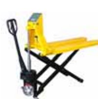
KPZ 74 M Paletový vozík s váhou