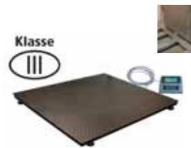
KPZ 2 M Ex Plošinová váha