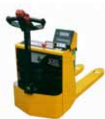
KPZ 72 M Ex Vážicí sada