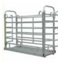
Váha na Zvířata M