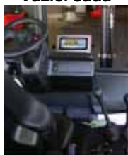
KPZ 39 Váha pro hydraulické vysokozdvížné zařízení