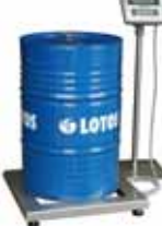
KPZ 2 B M