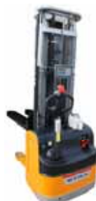
KPZ 73 M