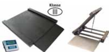
KPZ 2D M Ex Nájezdová (průjezdová) váha