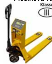
KPZ 71-* M Ex Paletový vozík s vahou