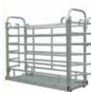
Váha na Zvířata M