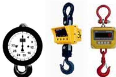
Jeřabové váhy M