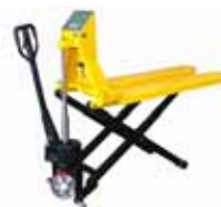
KPZ 74 Paletový vozík s vahou