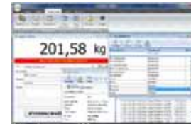
KPZ PC Software

Potřebujete jinou váhu, zvláštní produkty jsou naše specialita !