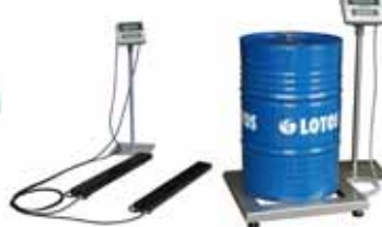
KPZ 1 B M