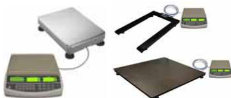
KPZ 2082 Systém počítačích vah