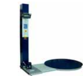
Vážicí systém pro stroje na balení palet