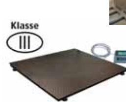
KPZ 2 M Ex Plošinová váha