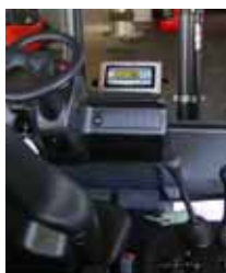
KPZ 39 Váha pro hydraulické vysokozdvíhací zařízení