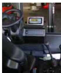
KPZ 39 Váha pro hydraulické vysokozdvížeňé zařízení