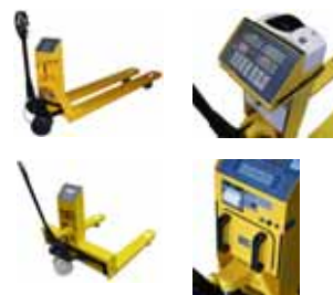
Příslušenství KPZ 71-7