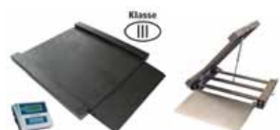
KPZ 2D M Ex Nájezdová (průjezdová) váha