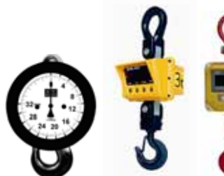
Jeřábové váhy M