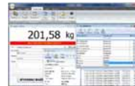
KPZ PC Software

Potřebujete jinou váhu, zvláštní produkty jsou naše specialita !