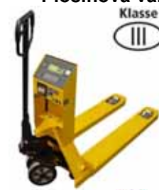
KPZ 71-* M Ex Paletový vozík s váhou