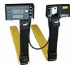
KPZ 76 M Váha na vysokozdvížeňé vozíky