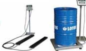
KPZ 1 B M