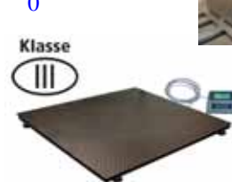
KPZ 2 M Ex Plošinová váha