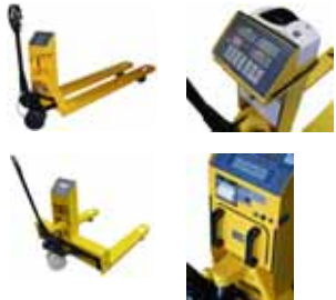
Příslušenství KPZ 71-7