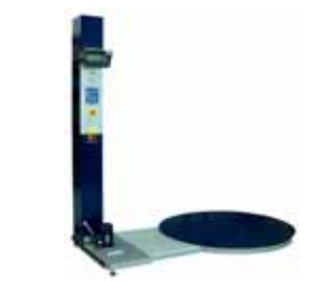
Vážicí systém pro stroje na balení palet