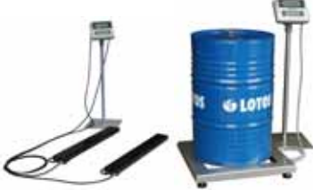
KPZ 1 B M