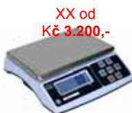
KPZ 2-11-3 M