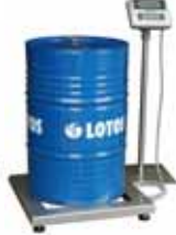
KPZ 2B M