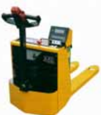
KPZ 72 M Ex Vážicí sada