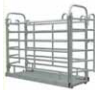
Váha na Zvířata M