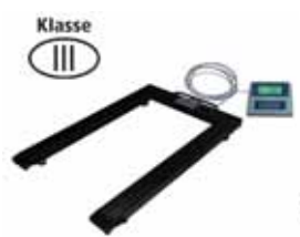
KPZ 1 M Ex Paletová váha