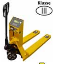
KPZ 71-* M Ex Paletový vozík s váhou