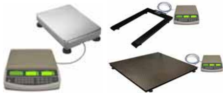
KPZ 2082 Systém počítačích vah