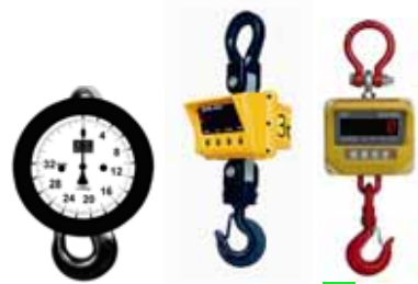
Jeřábové váhy M