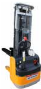
KPZ 73 M