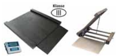
KPZ 2D M Ex Nájezdová (průjezdová) váha