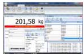
KPZ PC Software

Potřebujete jinou váhu, zvláštní produkty jsou naše specialita ! Smíme Vám také vyřešit problém s vážením ?