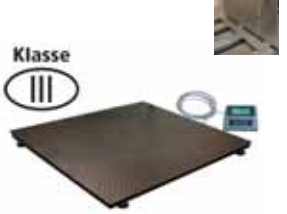
KPZ 2 M Ex Plošinová váha Klasse III