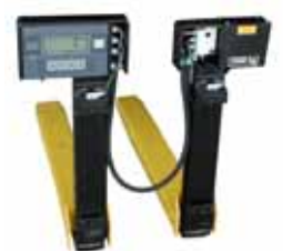
KPZ 76 M Váha na vysokozdvíhací vozíky