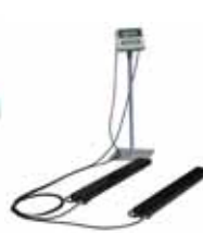
KPZ 1 B