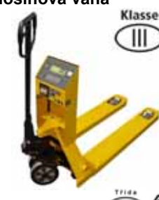
KPZ 71-7 Paletový vozík s váhou