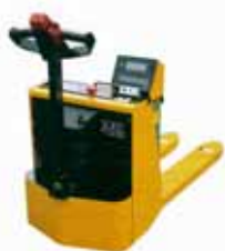
KPZ 72 Vážicí sada