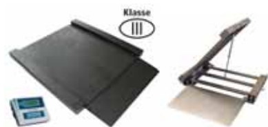
KPZ 2D Nájezdová (průjezdová) váha