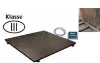
KPZ 2 Plošinová váha