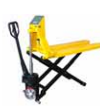
KPZ 74 Paletový vozík s váhou