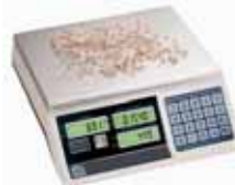
KPZ 2-04 Počítací váha