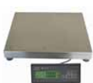
KPZ 2-11-3 Balíková váha