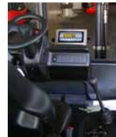
KPZ 39 Váha pro hydraulické vysokozdvizné zařízení

Potřebujete jinou váhu, zvláštní produkty jsou naše specialita !