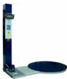
Vážicí systém pro stroje na balení palet