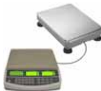
KPZ 2082 Systém počítačích vah