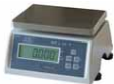
KPZ 2-03-10 IP 65 Vodotěsná váha