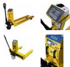
Příslušenství KPZ 71-7 Mnoho příslušenství