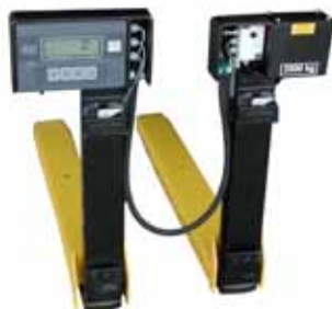
KPZ 76 Váha na vysokozdvizném vozíku