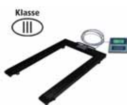
KPZ 1 Paletová váha