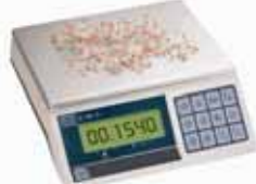
KPZ 2-03 Přesná váha