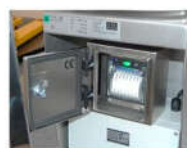
DR 7 IP 67